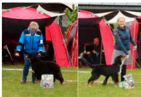
BIR og BIM Baby Støttrup's Athos & Støttrup's Athena

Til trods for dagsregnen var humøret fantastisk, grillen blev tændt og der var konkurrencer, amerikansk lotteri og masser af præmier takket være alle vores sponsorer.