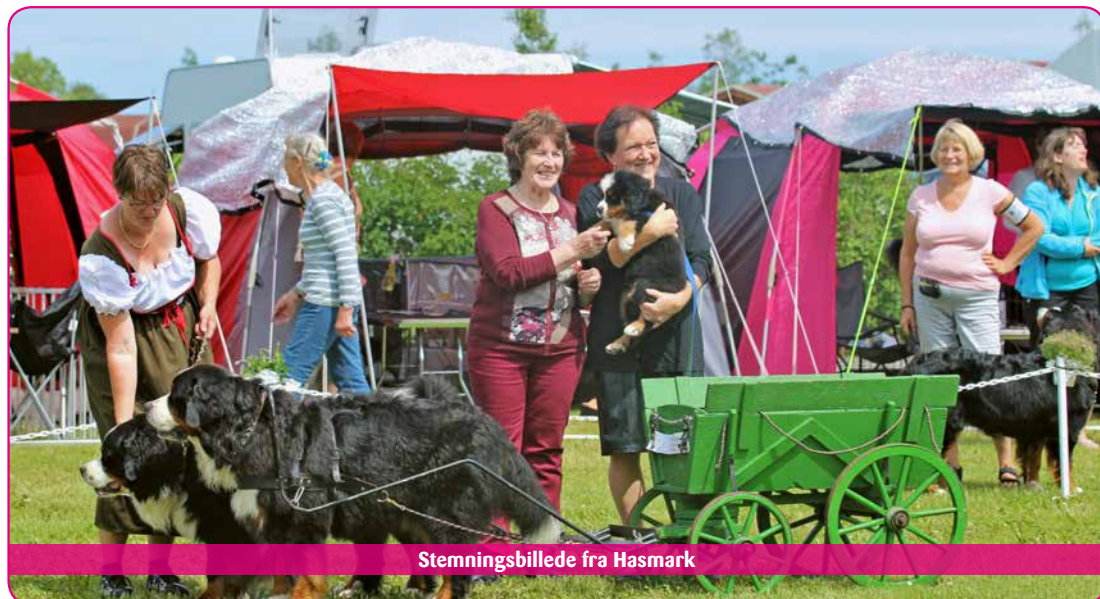
Stemningsbillede fra Hasmark