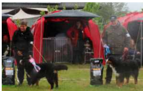
BIM & BIR Hvalp Berner-Emma's Æ Jerry Sidney & Fensholt's Tiga-Lilli