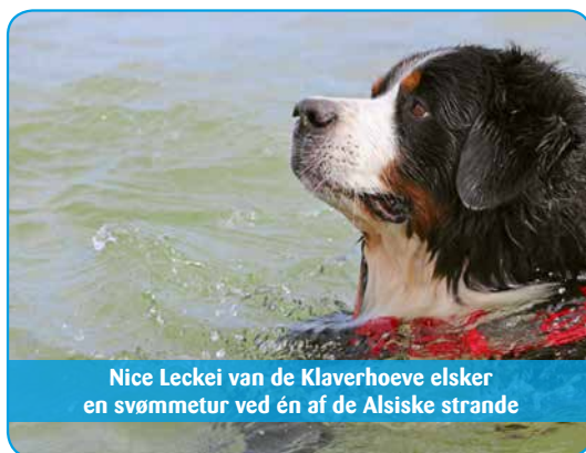
Nice Leckei van de Klaverhoeve elsker en svømmetur ved én af de Alsiske strande