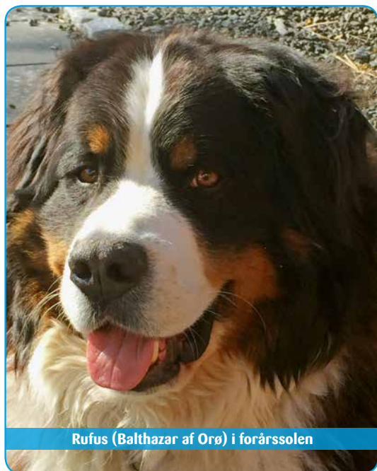
Rufus (Balthazar af Orø) i forårssolen