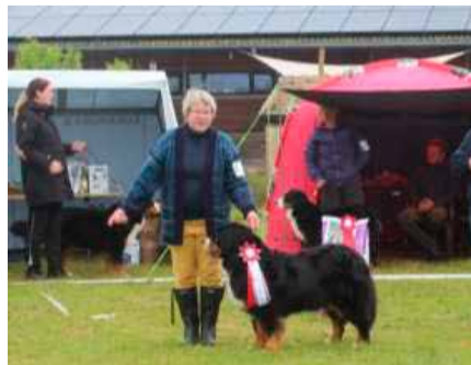
BIR Veteran Amazing Tiklo's Balu Magic

Barn og hund dommeren og fotograf var Gitte Shur Olsen. Stor tak til Gitte.