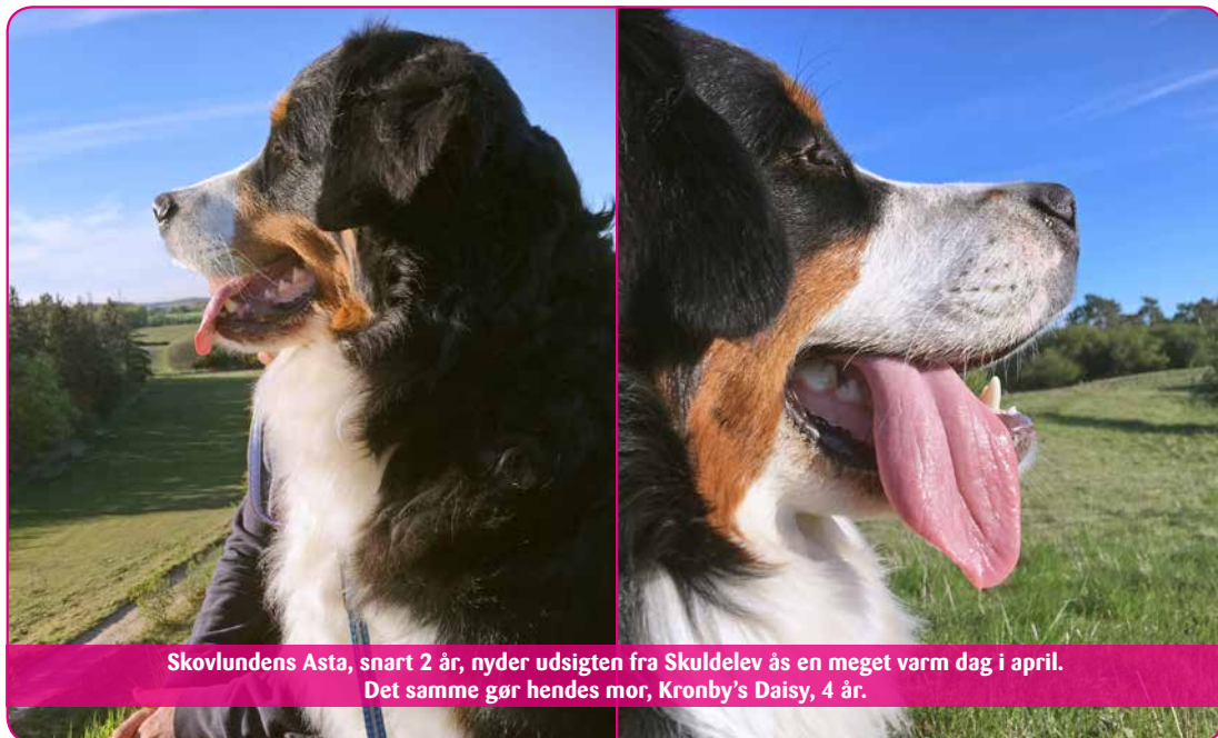
Skovlundens Asta, snart 2 år, nyder udsigten fra Skuldelev ås en meget varm dag i april. Det samme gør hendes mor, Kronby's Daisy, 4 år.