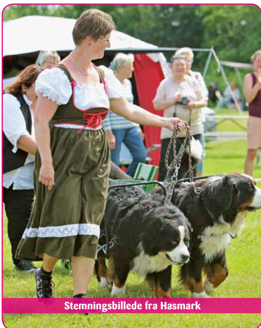
Stemningsbillede fra Hasmark