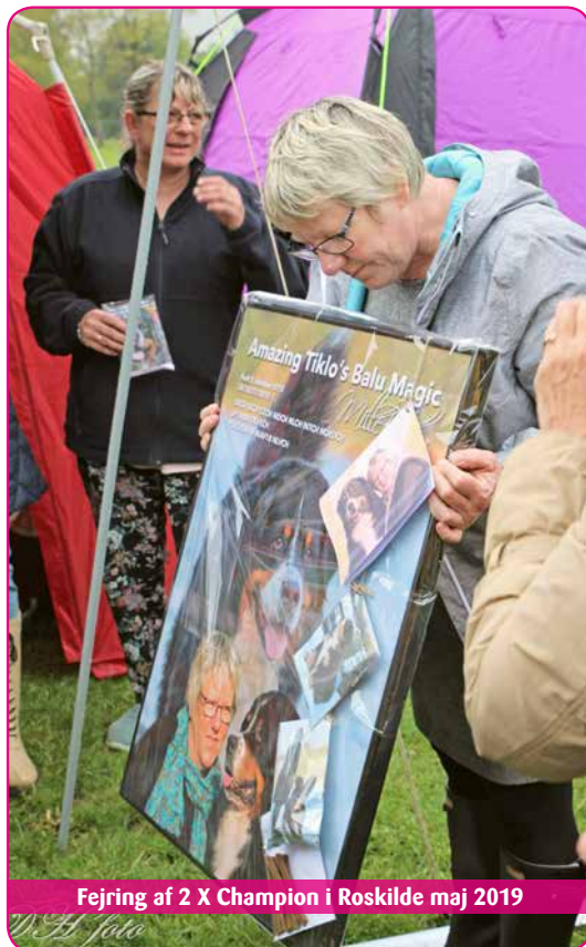
Fejring af 2 X Champion i Roskilde maj 2019