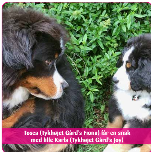
Tosca (Tykhøjet Gård's Fiona) får en snak med lille Karla (Tykhøjet Gård's Joy)