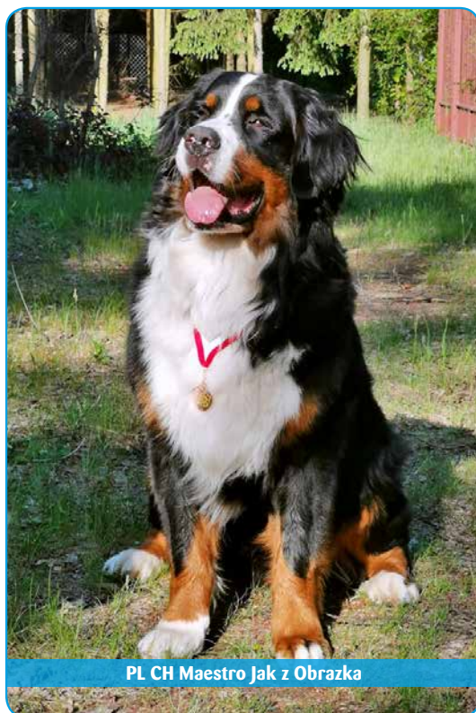
PL CH Maestro Jak z Obrazka