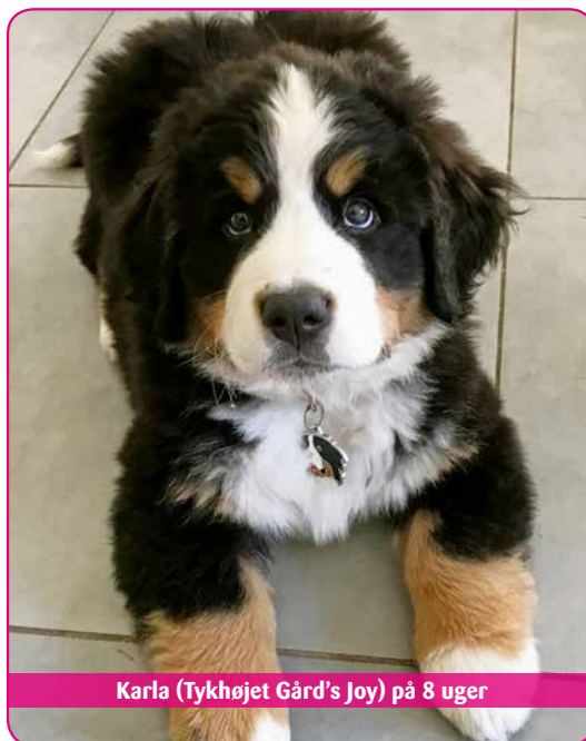
Karla (Tykhøjet Gård's Joy) på 8 uger