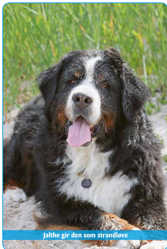
Jalthe gir den som strandløve