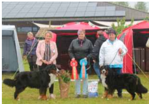
BIR & BIM Lady Xiera's Pepsi & Bakkeborgs Berner's Atilla