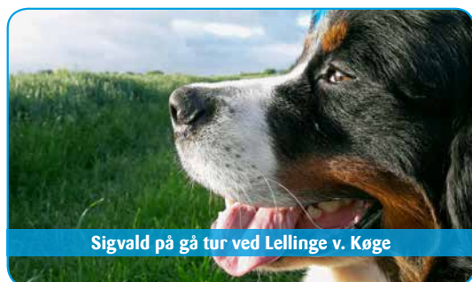
Sigvald på gå tur ved Lellinge v. Køge