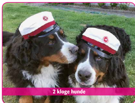
2 kloge hunde