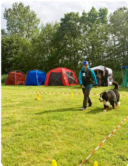
Billeder fra vognkørsels- arrangementet på Hasmark