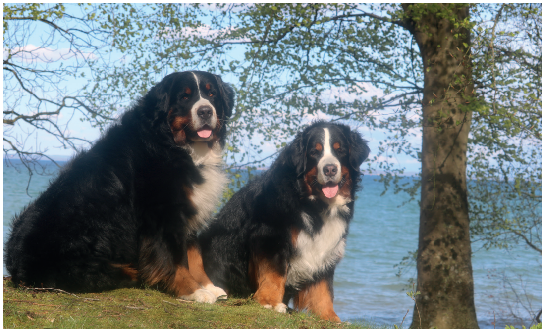
Harthins Yves Saint Laurent og Harthins Z har vendt ryggen til den flotte udsigt i Nørreskoven på Als

På hjemmesiden kan din dyrlæge også melde sig ind i klubben, i stedet for at benytte indmeldelsesblanketten.