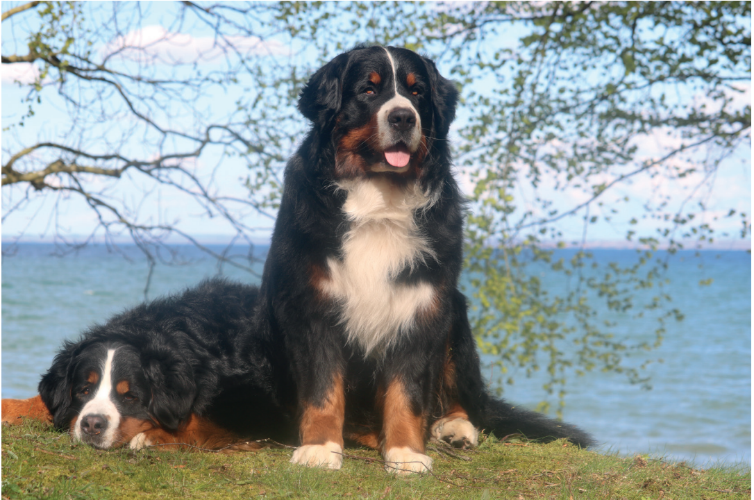
Harthins Yves Saint Laurent og Harthins Z poserer i Nørreskoven på Als