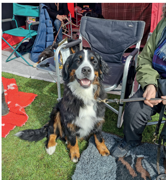
Fensholts Xenta. Ret ny i udstillingsver- denen, men tager det hele med et smil. Hun fik excellent her i Lunderskov.