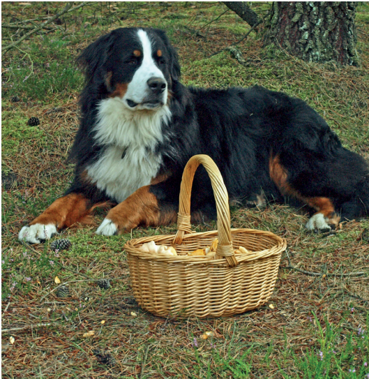
Kennel Tykhøjtegårds Kudu hjalp med at finde katareller sidste år.