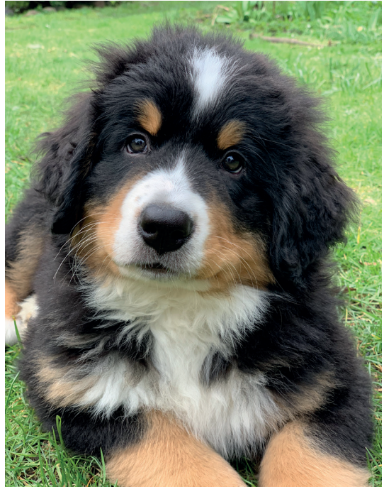
Irma i haven