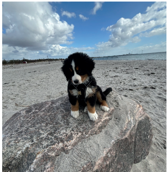
Karlas (9 1/2 uge) første tur til stranden