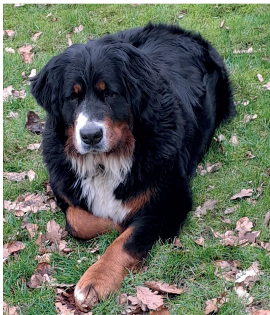
Ariel alias Bernadotte

Den variable selvrisiko kan være alt fra 10 procent til 35 procent, afhængigt af både forsikringselskab og af, om du for eksempel har en hund eller en hest. Det kaldes en variabel selvrisiko, fordi den varierer efter, hvad din regning lyder på. Prisen vil også variere ud fra, hvor stor en sum du ønsker at forsikre dit dyr for årligt. Skal der være et max på 20.000 kroner årligt til behandlinger? Eller 40.000 kroner? Mulighederne og priserne varierer igen meget mellem de forskellige forsikringselskaber.