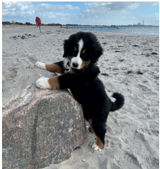
Karlas (9 1/2 uge) første tur til stranden