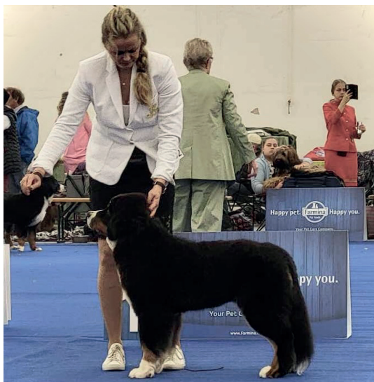
Berntiers Don Giovanni "Fabian" (CH Kronblommas Edoardo & Berntiers XPect the Dream)

BIR Baby Molossian Specialty & Croatian Minor Puppy Winner 24