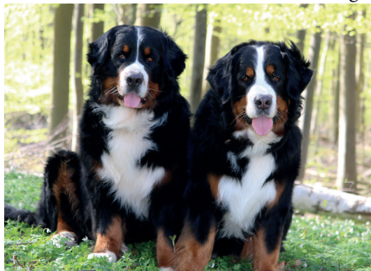
Harthins Yves Saint Laurent og Hartins Z pynter mellem anemonerne og den nyudsprungne skov