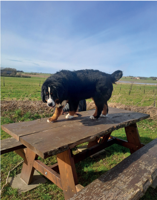
Terplingaards Flora alias bjerggeden Bella