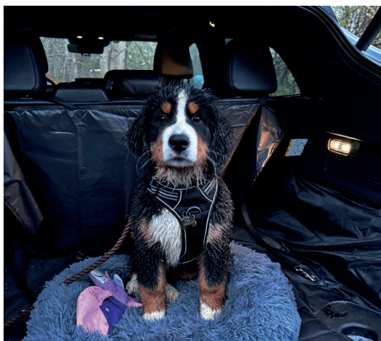
Hvalpe træning også i vådt vejr

Som kæledyrsejer er det i forvejen meget stressende, når ens dyr er sygt eller kommet til skade. Og hvis der er så store udgifter forbundet med behandlingen, at den muligvis må fravælges, står dyreejere over for en meget svær beslutning. Bliver dit dyr sygt eller kommer til skade uden for dyrlægens almindelige åbningstid, skal du også kunne betale minimum et vagttillæg på 100 procent, nogle steder helt på til 150 eller 200 procent. Det kan hurtigt løbe op i mange penge.