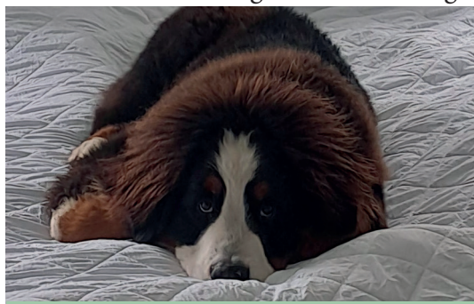
Terplingaards Jente alias Balder