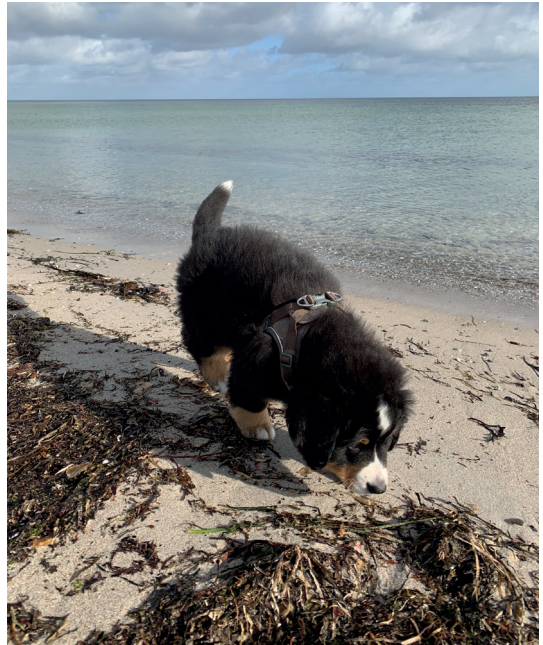
Irma på stranden for første gang