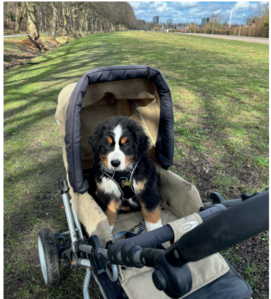
Efter strandtur er det rart med klapvogn. Når "storesøster" Nelly 2 1/2 år ikke skal snydes for motion, der skal jo passes på de små knogler