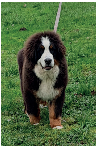
Terplingaards Jente alias Balder