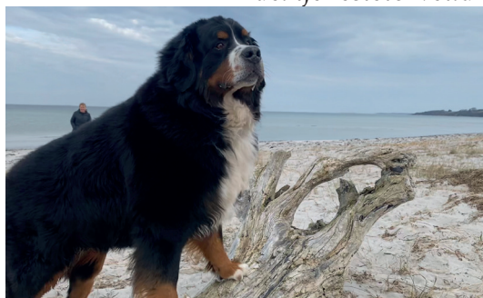
Prima-Sennen's Earl of Duchess nyder det fede strandliv