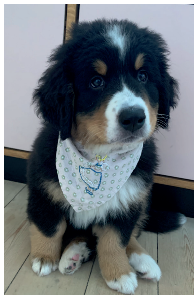
Irma 9 uger